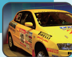
▶ PVC不乾胶/隔热膜 /车漆保护膜